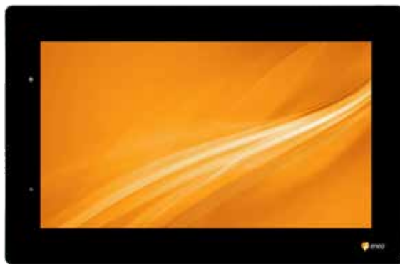
VM-UHD55MOH 55-Zoll Outdoor-Monitor, 4K UHD