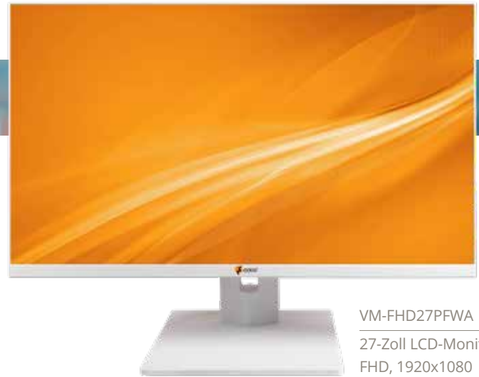
VM-FHD27PFWA 27-Zoll LCD-Monitor, FHD, 1920x1080